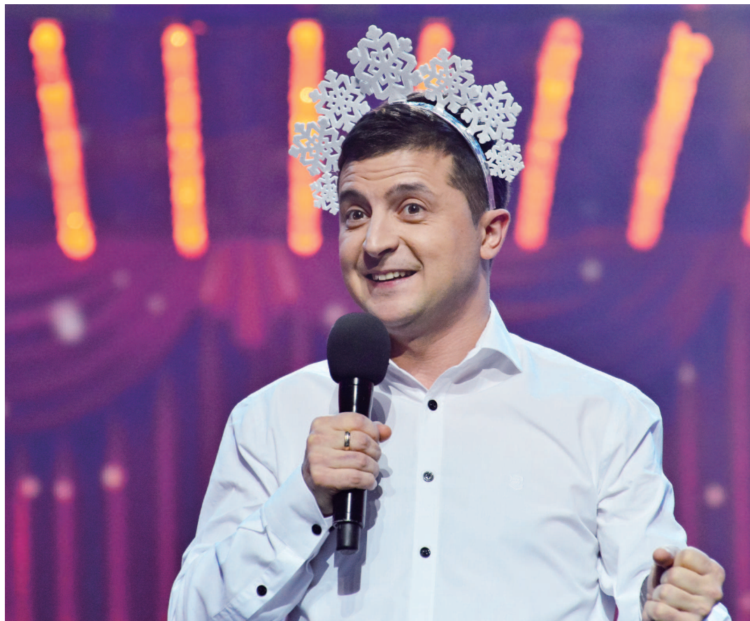
上图:泽连斯基出现在电视喜剧节目中,作为演员的他深受乌克兰民众喜爱。 右图:在电视剧《人民公仆》中,泽连斯基扮演的瓦西里作为政治“素人”,最终问鼎总统宝座,但依旧保持自己“普通人”的风格。 (资料照片)

生活总是惊人地相似,如今剧里的“总统”真的要竞选总统了,就是不知道乌克兰民众是否乐意把荧屏里的生活过成现实。