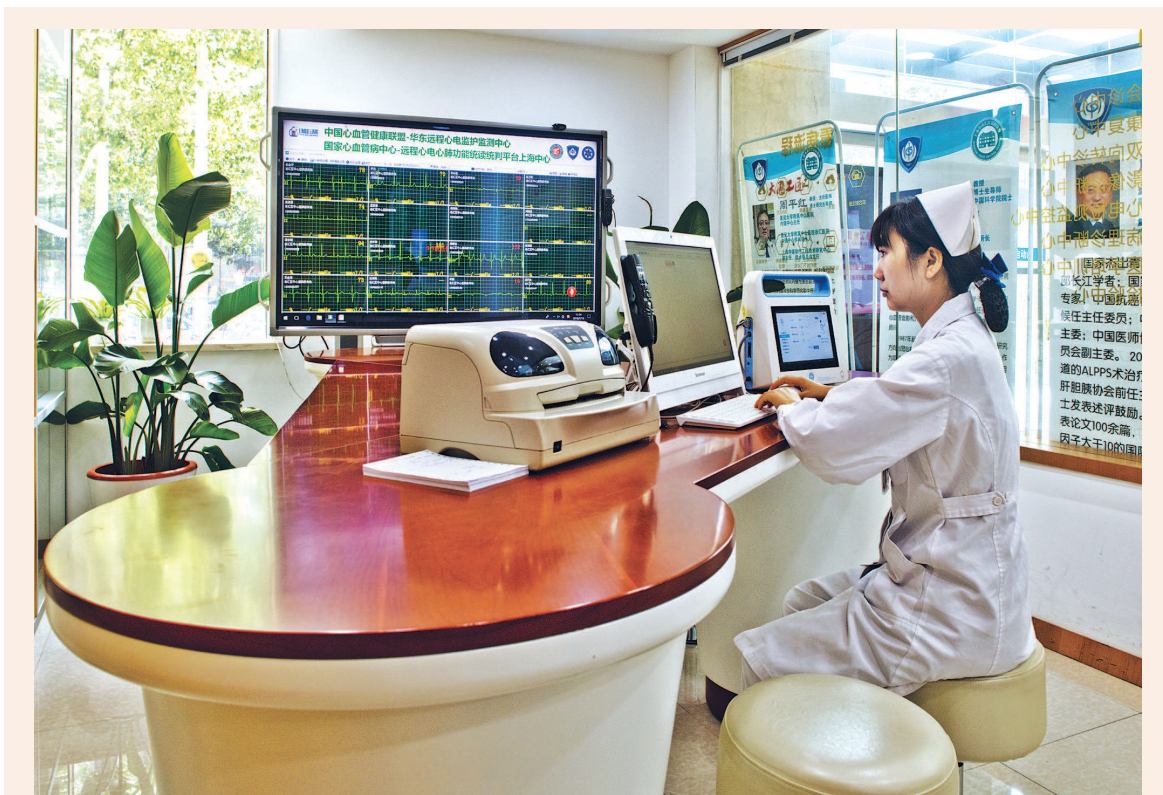
“健康服务业50条”落地半年以来,上海健康服务发展能级与核心竞争力进一步提升。图为上海首家“云医院”不仅深耕上海,还辐射全国十多个省份,在放大优质医疗资源的同时,开启了对现有医疗卫生服务体系的一次重构探索。(资料照片)

与这些配套,上海还在大力推进健康保险交易平台建设。去年10月23日,市卫生健康委与上海保险交易所签约,合作推进全国首个健康保险交易中心建设,先期试点开展保险产品创新和核保理赔服务等工作。