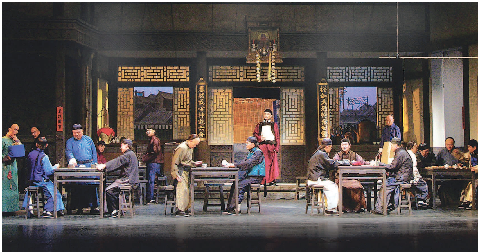
北京人艺《茶馆》的舞美设计是写实风格的。作为舞台艺术的一部分已经成为作品趣味和思想体系的一部分。图为剧照。