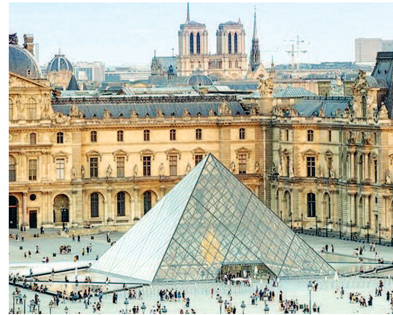
2018年卢浮宫博物馆共接待参观者1020万人次。(资料照片)

此外,为了提高游客舒适度,卢浮宫近年间共花费了6000万欧元用来修建改造各项设施。今年秋天,为纪念意大利著名画家莱昂纳多·达·芬奇逝世500周年,卢浮宫将专门开设大型展览。