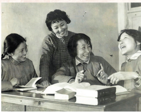
于漪（右二）和年轻教师们一起进行教研活动。