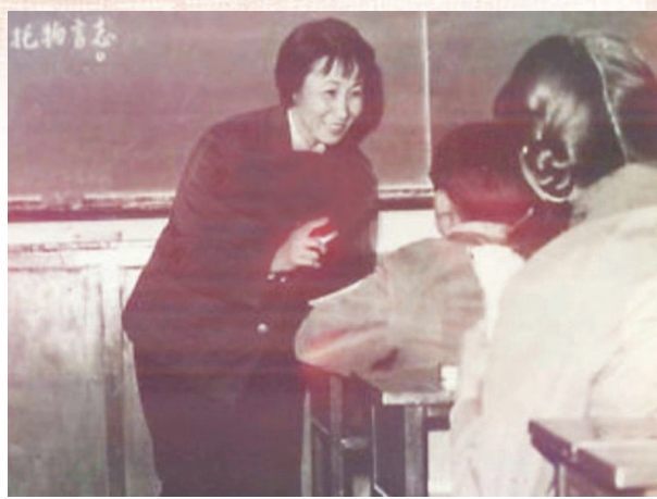
于漪给学生们上课。对于教育，她有着热忱的追求。