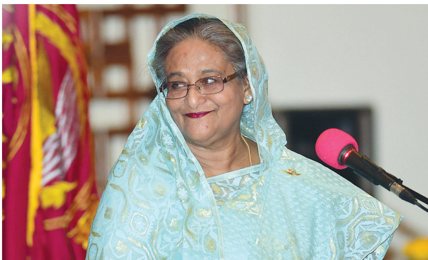
7日,连任总理哈西娜出席新内阁宣誓就职仪式。