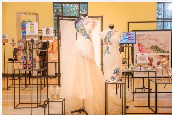
缂丝工艺运用到时尚礼服中,碰撞出别样的美。

非遗不是静止不动的,它的“世代相传”,不是同一个东西、同一种方式永远不变地一代一代传下去,而是文化传统在一代代人的能动实践中不断被赋予新的创造