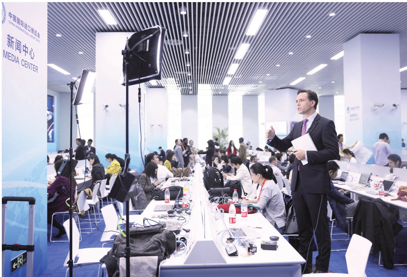
在上海举办的首届中国国际进口博览会的新闻中心,中外媒体记者在工作(2018年11月5日摄)。