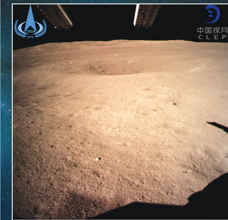
嫦娥四号着陆器监视相机C拍摄的着陆点南侧月背背面图像,巡视器将朝此方向驶向月球表面。

3日10时26分 成功着陆在月球背面东经177.6度、南纬45.5度附近的预选着陆区 11时40分 获取世界第一张近距离拍摄的月背影像图并传回地面 22时22分 着陆器与巡视器成功分离,玉兔二号顺利驶抵月背