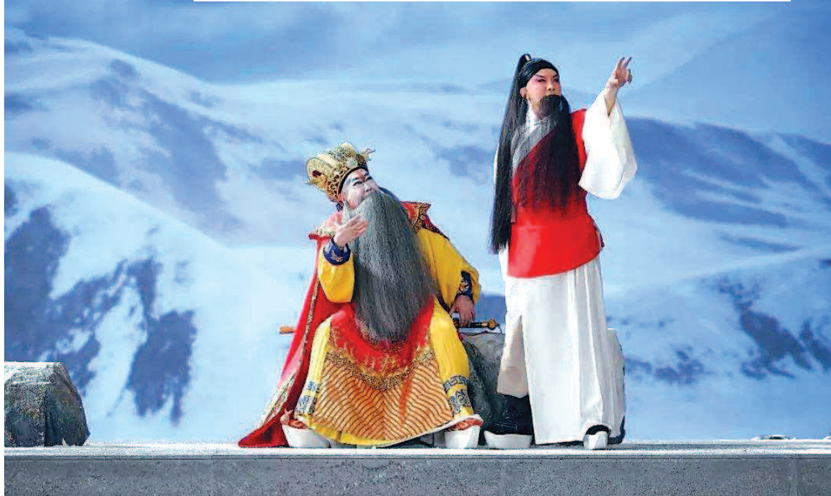
上海京剧院与上海广播电视台合作出品的3D全景声京剧电影《曹操与杨修》，成为第一部进入商业院线的戏曲电影。