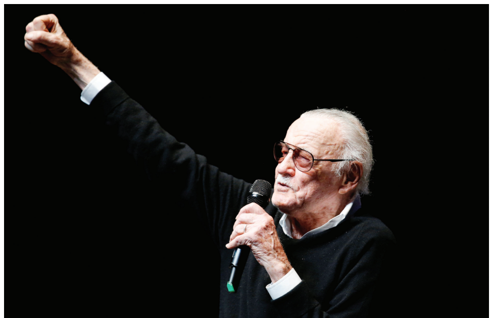
“漫威之父”斯坦·李创造了有血有肉的“不完美”的英雄形象。