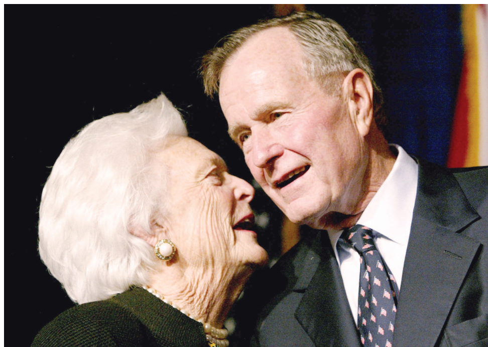
老布什夫妇同一年去世,他们是美国“最长情”的总统伉俪。