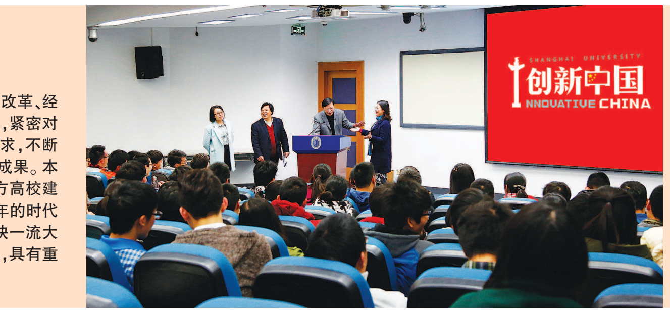
图为:上海大学“大国方略”“创新中国”等课程深受学生喜爱。