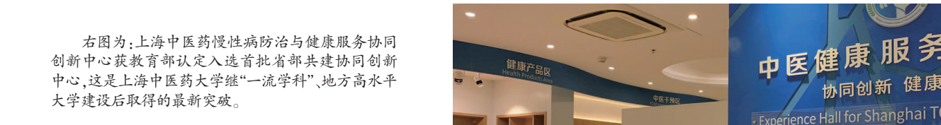
右图为:上海中医药慢性病防治与健康服务创新中心,该中心被教育部认定为首批省部共建协同创新中心。