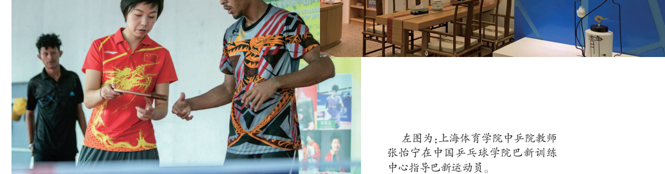
左图为:上海体育学院中国乒乓球队巴新训练中心指导巴新运动员。