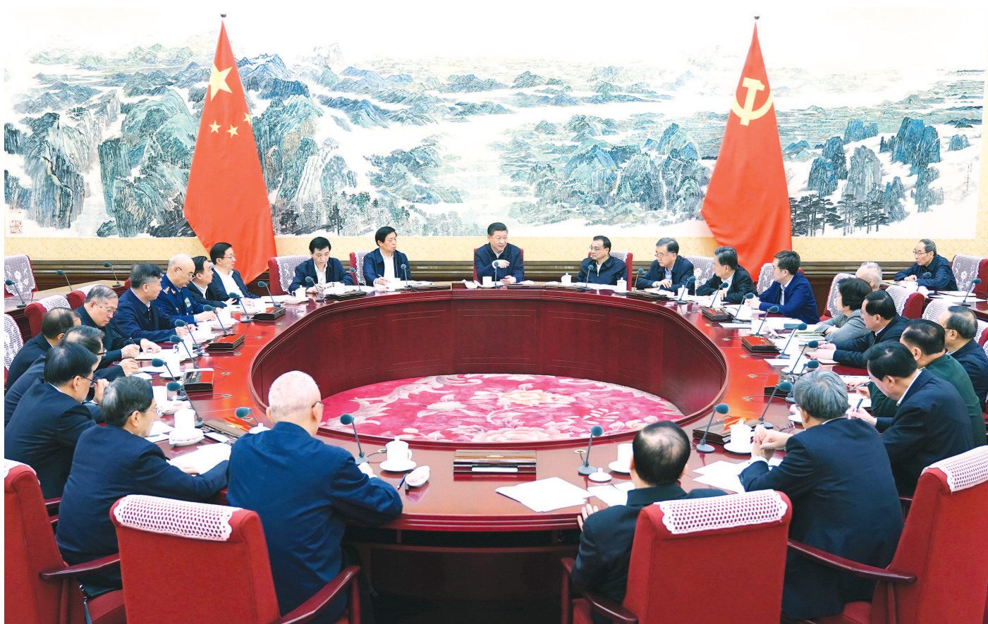
12月25日至26日,中共中央政治局召开民主生活会。