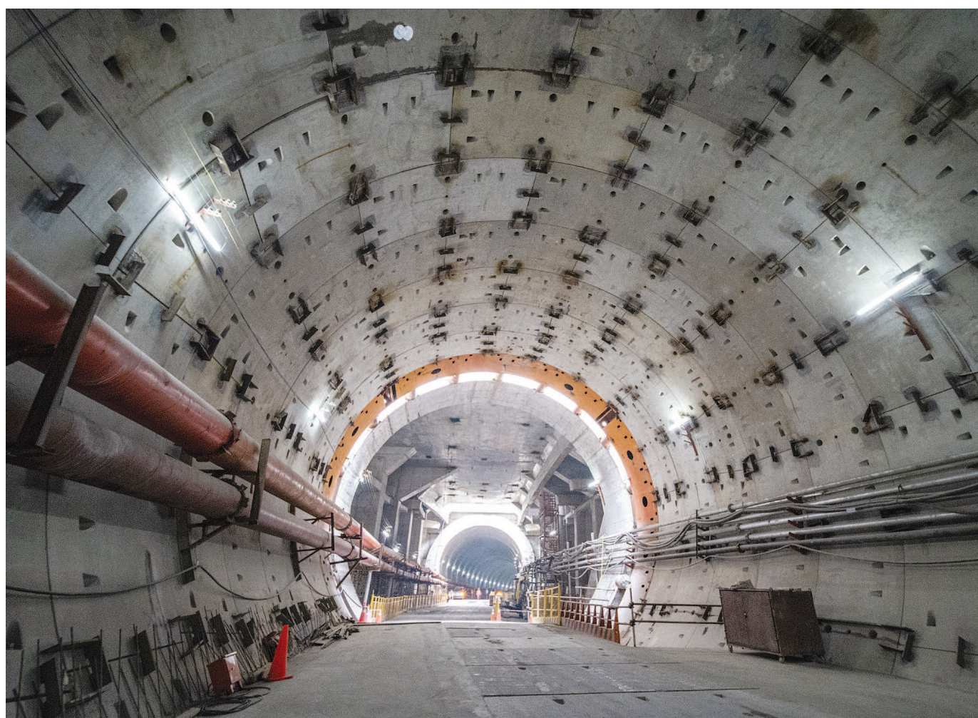
“纵横号”盾构23日顺利推进至600环,提前七天完成了北横通道年度工程节点。

本报讯(记者王嘉露)北横通道是上海中心城区“三横三纵”骨架性主干路网的重要组成部分,西起北虹路,东至内江路。记者昨天从上海城投公路集团获悉,“纵横号”盾构于前天顺利推进至600环,提前七天完成北横通道年度工程节点。 今年6月,上海最大直径盾构“纵横号”在北横通道工程中山公园工作井始发,开始了它的西线东段掘进任务。与此前已经推进完成的西线西段工程相比,东段沿线的掘进任务难度更高。逾百栋房屋建筑、五条轨道交通线以及不计其数的城市生命管线,都是“纵横号”盾构需要穿越的目标。不仅如此,在穿越这些建筑物的同时,“纵横号”还可能面临急曲线转弯、浅覆土、不利地层等多种风险,工程难度及面对的挑战可以说是前所未有的。 回望过去半年来的建设过程,西线东段隧道的掘进首战便困难重重。“纵横号”要连续穿越兆丰别墅群、迅发公寓等百年历史建筑群。兆丰别墅因西邻兆丰公园(今中山公园)而得名,建于上世纪30年代,迄今已有近百年历史,是沪上高级住宅区之一。1999年,它被评为上海市优秀近代建筑。但是,对于施工团队而言,这却意味着更高难度。由于该建筑群年代久远,基础相对较差,因此施工难度极大。 掘进前,上海城投公路集团进行了多方论证,编制专项施工方案,提前做好应急储备;对房屋检测评估,建立房屋档案,一屋一档,一屋一策;采用自动化监测系统,实时反馈监测数据,指导盾构穿越施工;成立联合值班小组,各尽其责,统一管理;发挥党建引领作用,及时沟通信息,与周边居民开展互动。在多方共同努力下,“纵横号”于7月26日完成西线东段隧道第100环的推进,成功穿越百年历史建筑群,并将沉降控制在毫米级。 “纵横号”面临的第二个重要任务是下穿轨道交通11号线隆德路一站江苏路站区间隧道。直径15米级的盾构下穿运营地