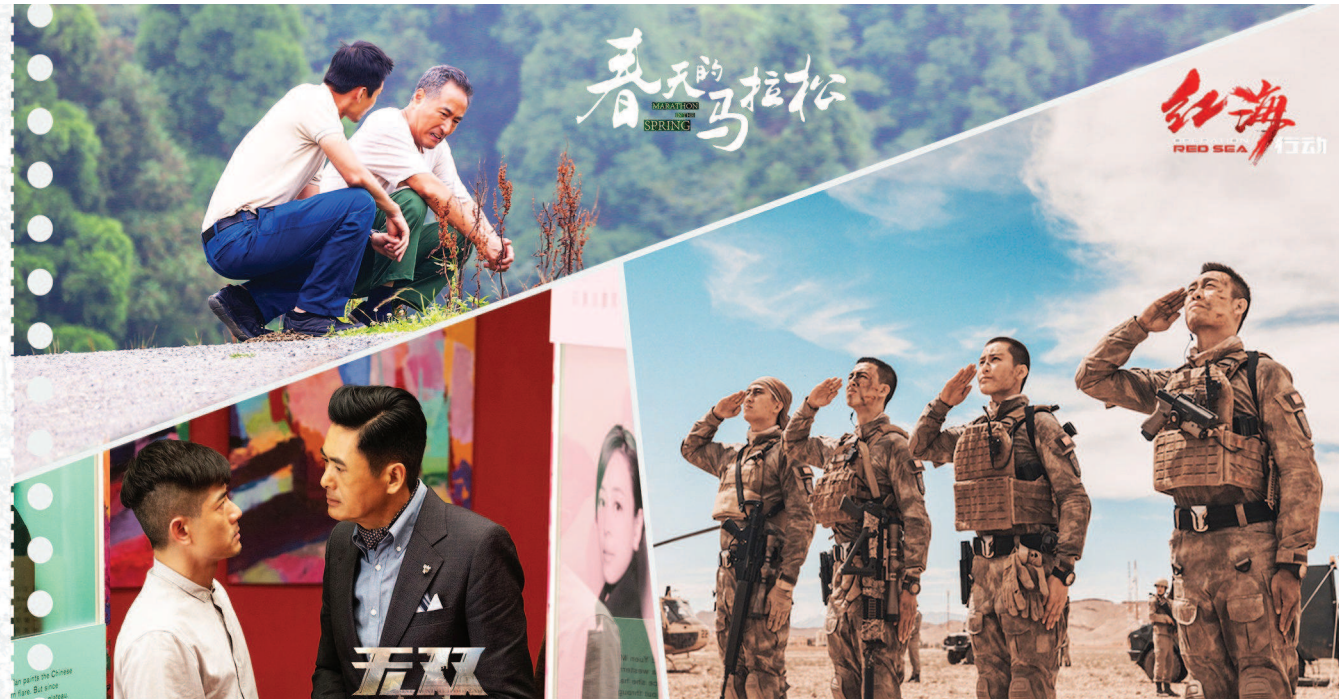
这一年,家国情怀燃了,现实主义火了,新锐导演热了,好电影的春天真的可以期待了。图为电影《春天的马拉松》《无双》《红海行动》海报。