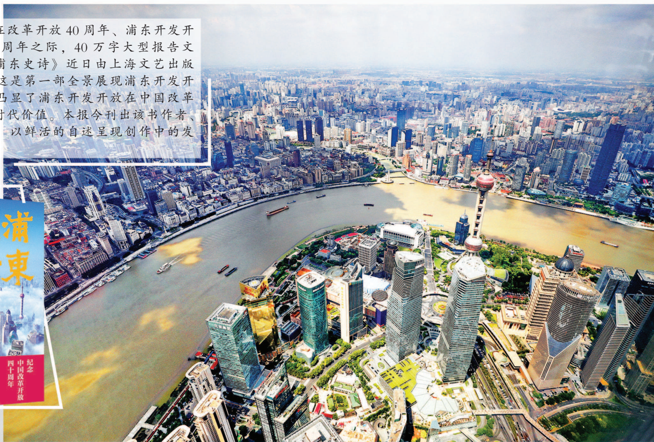
如今的浦东陆家嘴地区，摩天大楼鳞次栉比。