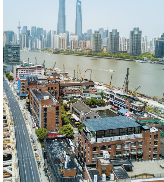
▲老码头创意园区是南外滩的新地标。由原来的十六铺改造而成，保留了最富上海韵味的石库门建筑风格，又巧妙融入了玻璃和钢结构的现代元素。(视觉中国)