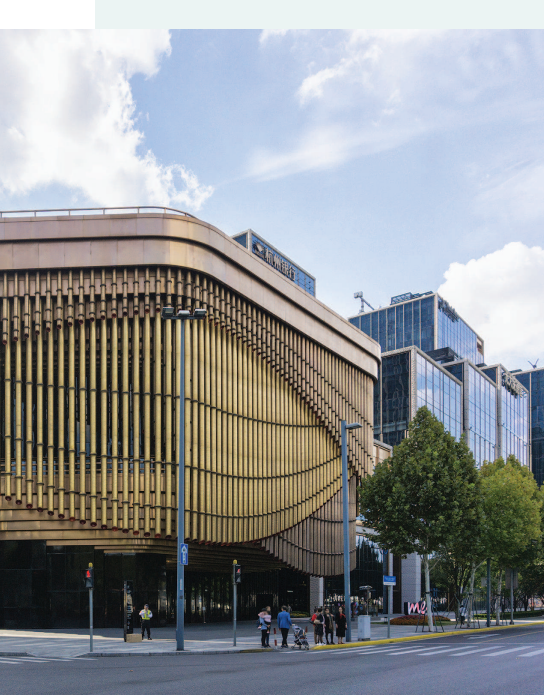
▲复星艺术中心集合音乐会、戏剧演出、时装、艺术画廊展览、学术演讲等功能，是一个用途多变的建筑空间。