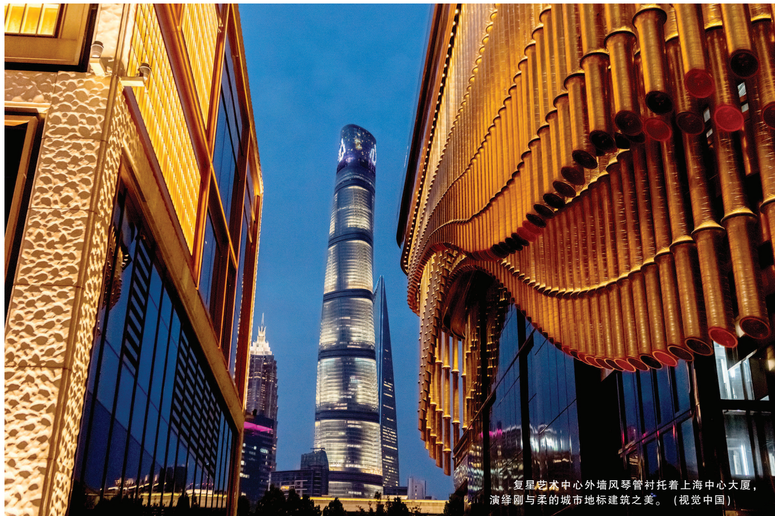
复星艺术中心外墙风琴管衬托着上海中心大厦，演绎刚与柔的城市地标建筑之美。