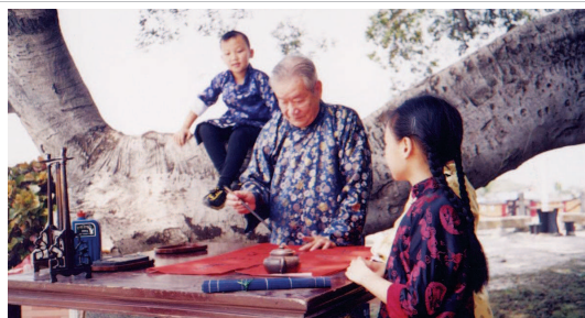
《我的外公张人希》 林竹青著 上海三联书店出版