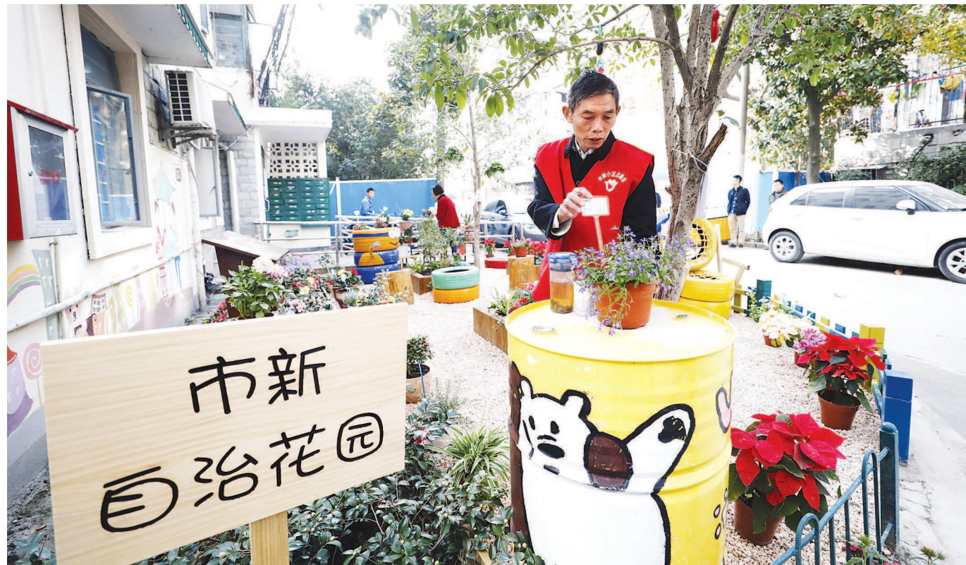
陆家嘴街道市新居民区的自治花园,环境优美,花香扑鼻。

步入党建服务中心,一面粉色心愿墙十分惹人注目,党员们可以在这里认领他人的心愿。这些心愿并不会给认领者带来较大经济负担——经平台审核,每个心愿投入资金