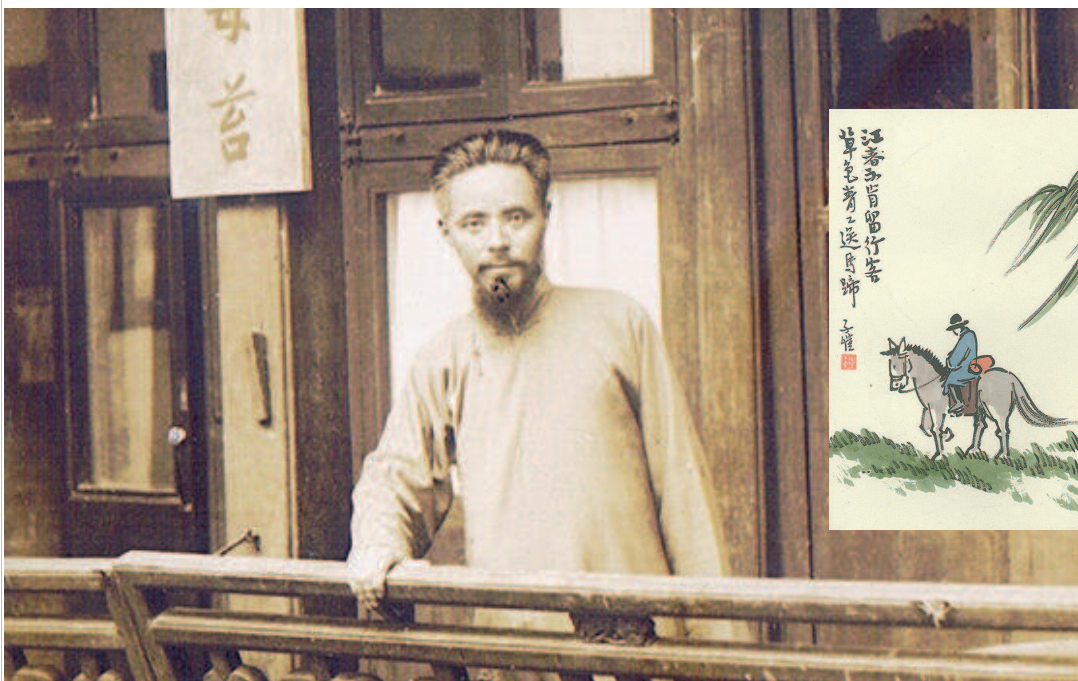
丰子恺先生(1936年10月摄于杭州田家园)及其漫画作品。

这是一本好看、另类的世界历史书，直接明晰地揭示了历史上不同国家兴衰的关键。古罗马因偷税灭亡？无敌舰队竟被“消费税”击沉？无敌拿破仑却败给了“货币战争”？“一战”导火索是“德国经济的飞速发展”？如果说世界历史是人类如何追求财富、财产的历史，那么人类追求财富、财产的本质从古至今从未改变。所以，摸清金钱的脉络，世界史的脉络也自然跃然纸上。从金钱的流动和财富的积累、走向，来分析解读世界各国的历史，可以更直观、更明晰地了解世界史，了解历史的本质。