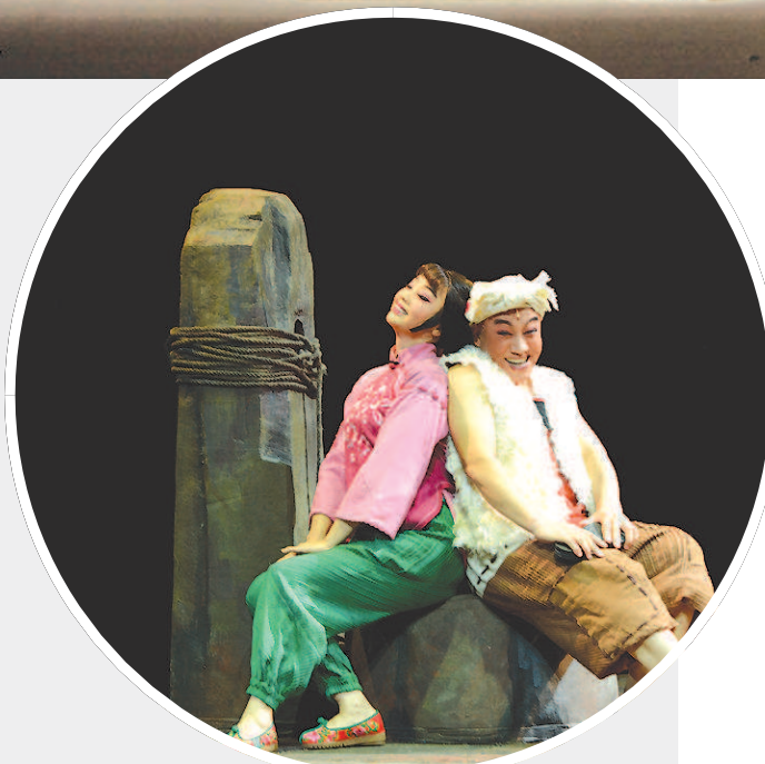
►宁夏演艺集团秦腔剧院秦腔现代剧《王贵与李香香》借助秦腔与现代合唱队的结合开拓传统戏曲的现代表达，实现“革命题材诗性的表达”。