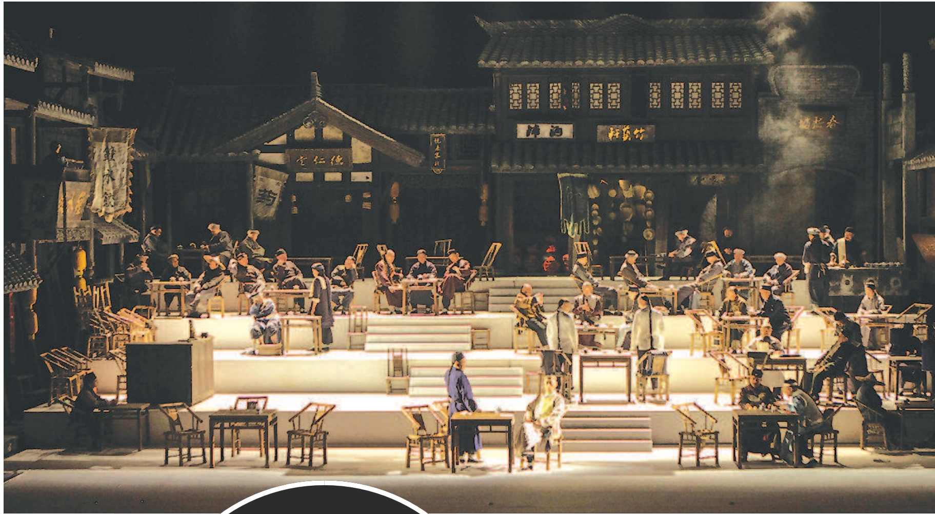
▲四川人艺方言版话剧《茶馆》处处可见浓郁的巴蜀风情：四川盖碗茶、四川特色竹椅凳、“冰粉儿、凉糕、凉粉儿、凉面”的吆喝声以及“吱吱喳喳”作响的竹椅……

“冰粉儿、凉糕、凉粉儿、凉面”的吆喝声、“吱吱喳喳”作响的竹椅，还有幕间串场的金钱板，此情此景下演绎的却是中国话剧经典剧目《茶馆》，全方位的“四川化”和演员的精彩表现让剧本焕发了全新的光彩。少了照搬，多了创新，当经典为观众开启了一个全新入口，谁又能说这台“川味十足”的《茶馆》不好看呢？