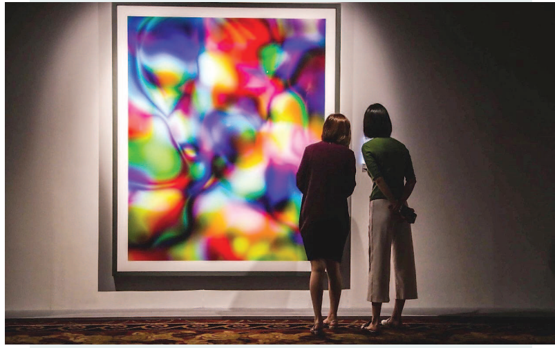
▲佳士得2018上海秋拍预展现场