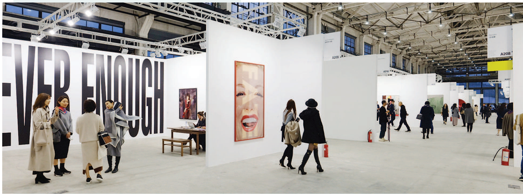
▲前不久落下帷幕的第五届西岸艺术与设计博览会,首次以“双馆”模式亮相,吸引来自亚洲、欧洲、北美洲和南美洲43个城市超过110家画廊参展

“努力把上海建设成为世界重要艺术品交易中心之一”,这是“上海文化品牌三年行动计划”“上海文创50条”为上海勾画的蓝图之一。如今,随着一系列重量级艺术博览会的密集登场,美好的图景已清晰显现出来。