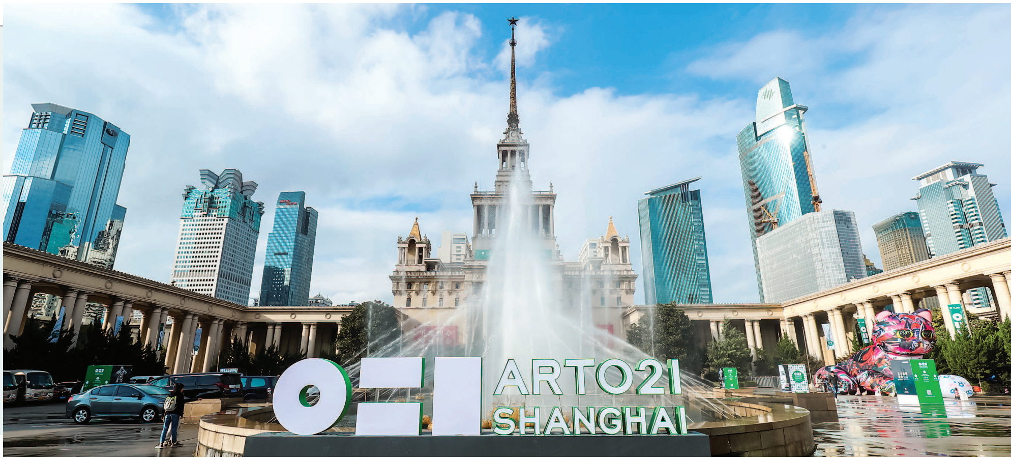
右图:今年第六届上海廿一当代艺术博览会,在短短四天内接待的观众数逾八万

近150个艺术展在一个月内密集登场,海外大牌艺术机构、艺术家纷至沓来,一个全新的国际艺术品交易中心呼之欲出——