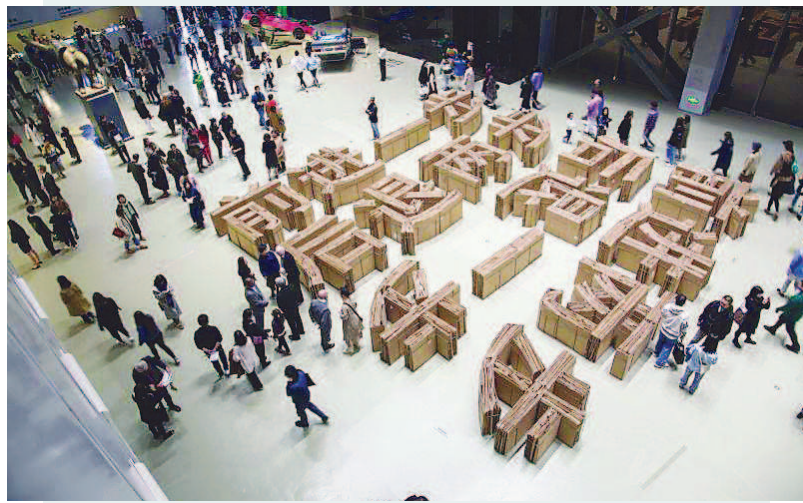
▲正于上海当代艺术博物馆举办的“高步——第12届上海双年展”现场