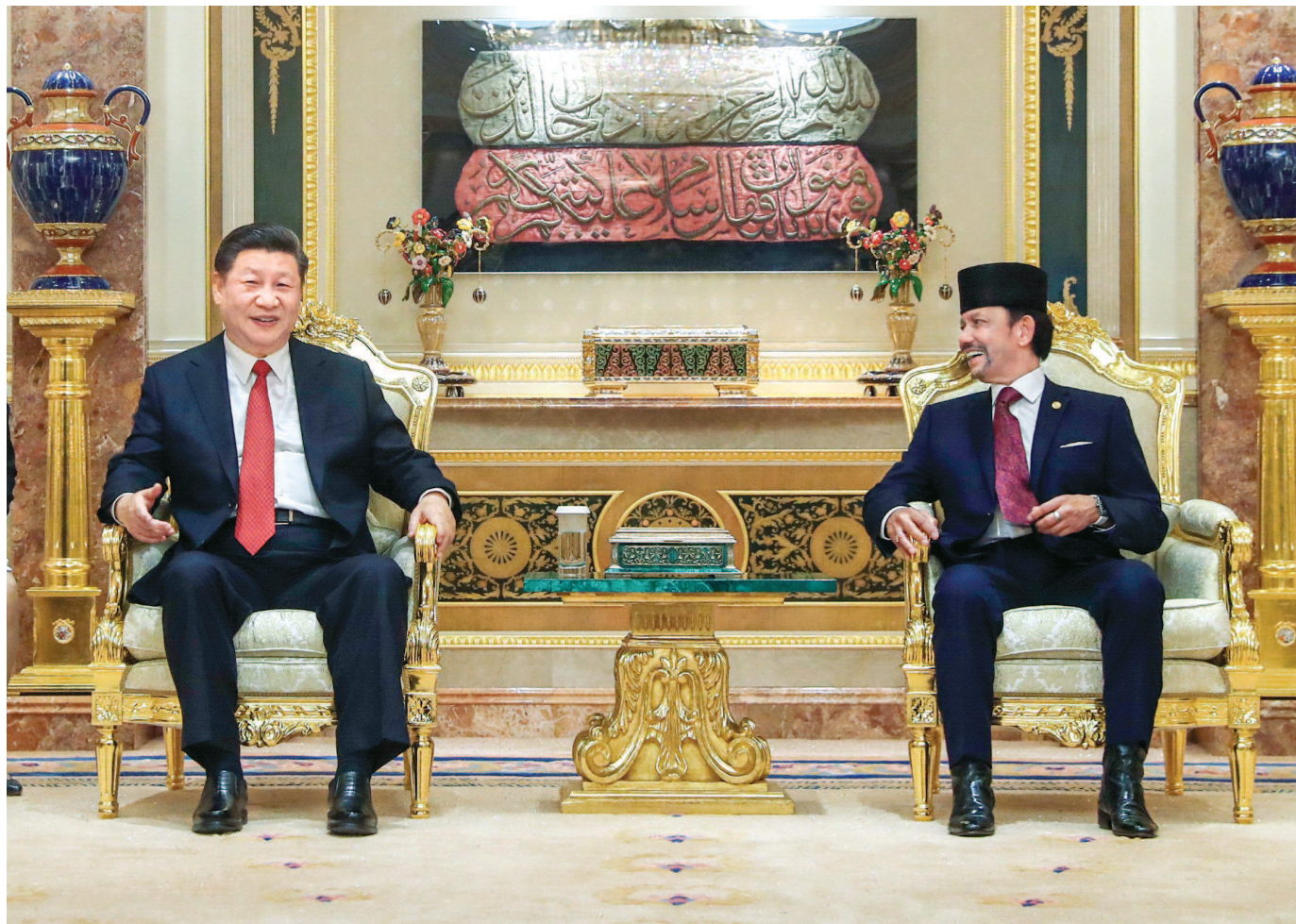
11月19日,国家主席习近平在斯里巴加湾同文莱苏丹哈桑纳尔举行会谈。