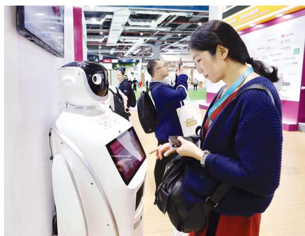
在进博会医疗器械及医药保健展区，一批优质产品和领先技术闪亮登场。图为在阿斯利康展位，一位客商与智能医疗机器人“对话”。

国的本土研发能力，通过自主研发与跨界合作推动七个1.1类新药（指未在海外市场上市、半合成类药物）在华研发。此次阿斯利康展示的一款未上市新药——全球首创的治疗慢性肾病贫血口服药物罗沙司他已进入上市冲刺阶段，有望成为中国本土研发、中国最先上市、中国首批销售的创新药物。“一旦（罗沙司他）在中国获得批准，上市将比美国和日本都早，这是以前没有发生过的，也是中国巨大市场带来的新机遇。”王磊表示。