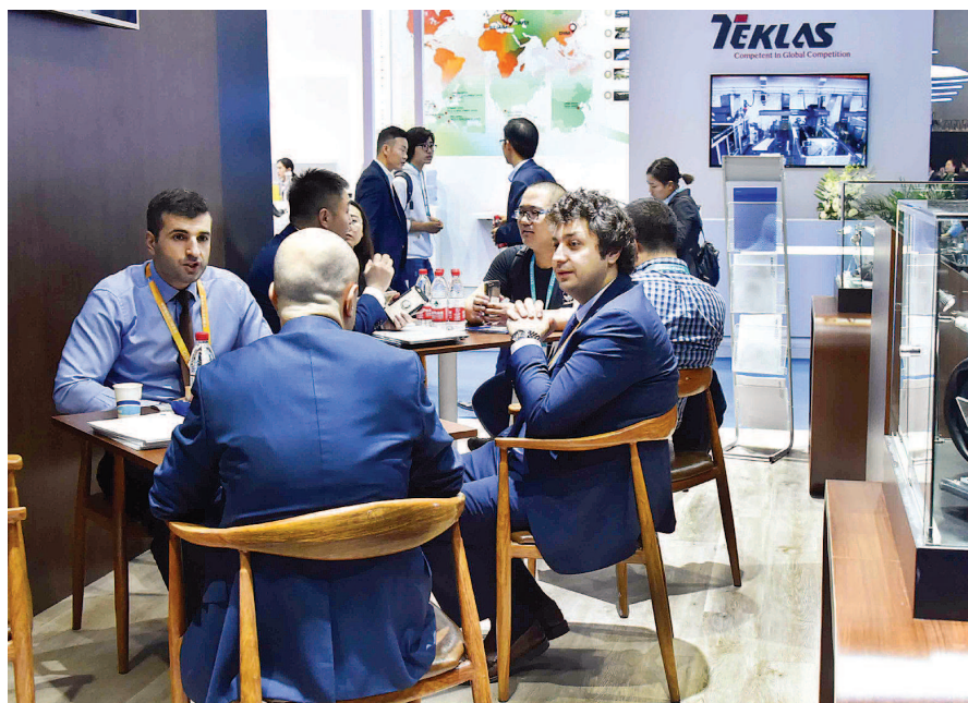
首届中国国际进口博览会万商云集，中外嘉宾接洽贸易。

《报告》显示，去年全球服务进口规模前五名国家依次是：美国(5381.1亿美元)、中国(4675.9亿美元)、德国(3236.5亿美元)、法国(2404.7亿美元)、英国(2149.5亿美元)。中国(内地)服务进口