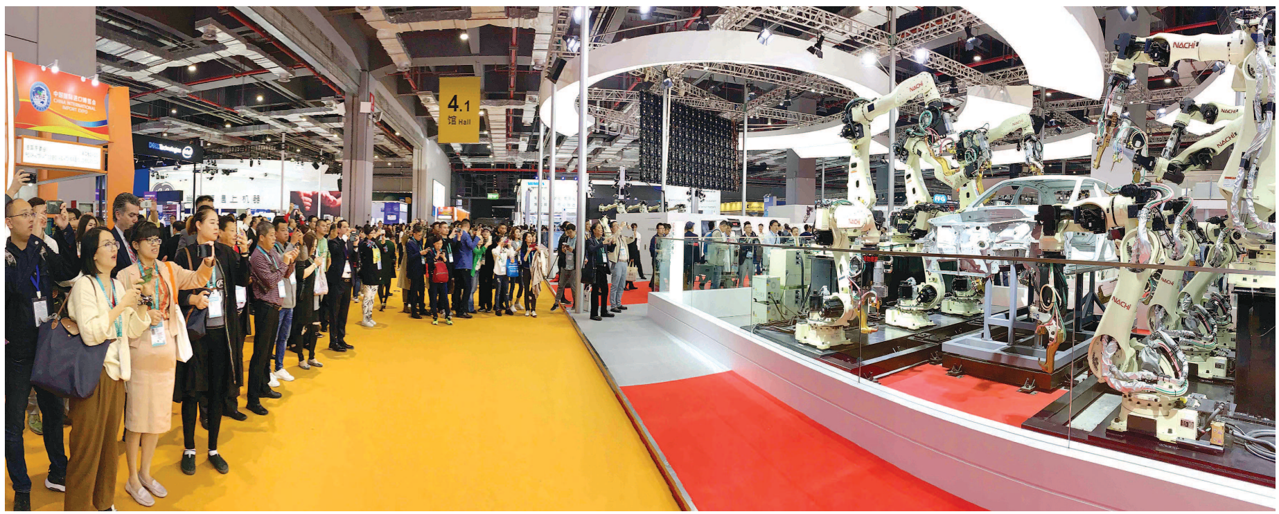
来自五大洲的3600多家参展企业在进博会与采购商们充分对接洽谈、共谋发展。图为观众在智能及高端装备展区观看高密度机器人手臂演示汽车焊接装配。