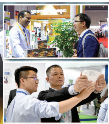
展商客商们在进行交流洽谈。