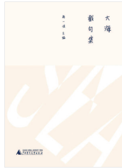
《大海截句集》 蒋一谈主编 广西师范大学出版社 (2018年7月版)

见海量”的意境:诗人的直觉、超验、会意、生成性、不可解、自我遣性等,以一种类似于语言游戏的形态表现出来,以一滴水、几行字的有限凝聚一片海的无限与无垠,虽寥寥数字,却铿锵有力、意味无穷,在段子、短信、微信等碎片化写作充盈于日常的当下,“截句”这种以一寓万、片言夺魂、微言宏旨的手法或可为未来的诗歌创作提供一种可能性和生长点。