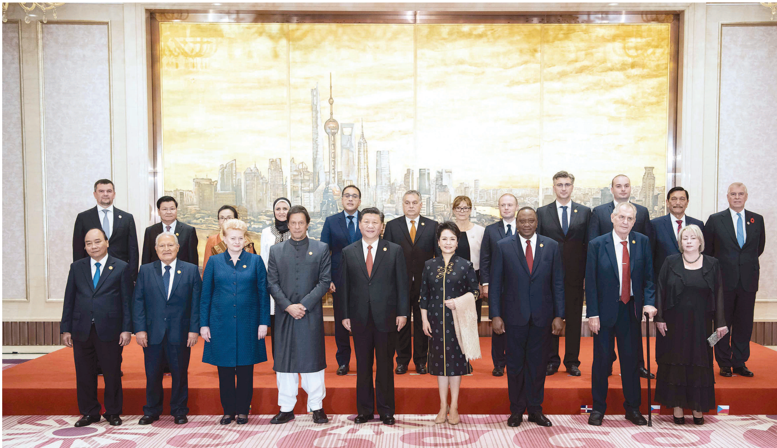
11月4日晚，国家主席习近平和夫人彭丽媛在上海举行宴会，欢迎出席首届中国国际进口博览会的各国贵宾。这是宴会前，习近平和彭丽媛同各国领导人夫妇合影留念。