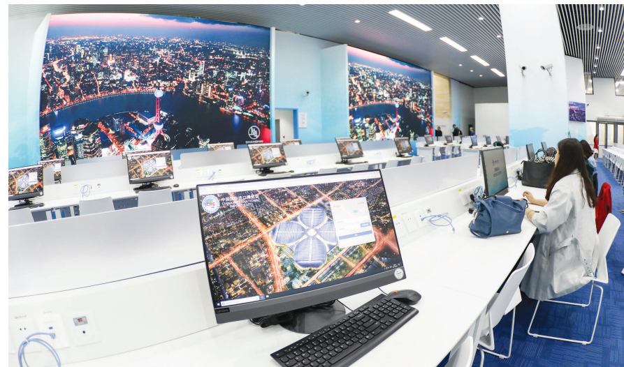
进博会新闻中心媒体公共工作区有近500个工作位, 各种设施齐备, 方便中外记者聚焦盛会。

寄存柜, 支持人脸识别寄存物品。操作非常简单——寄存柜上只有两个按钮, 按下“存”的按钮, 系统会提示进行人脸识别, 扫描完毕后柜门就会打开; 而按下“取”的按钮, 人脸识别认证以秒计算, 比传统