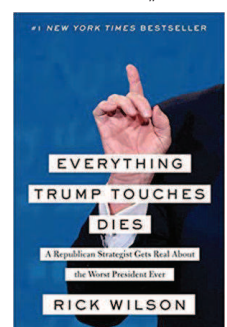
Everything Trump Touches Dies: A Republican Strategist Rick Wilson (2018年8月版)