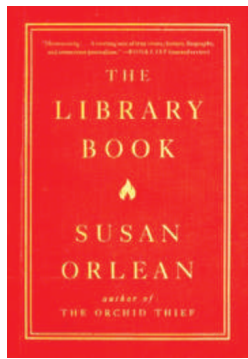
The Library Book Susan Orlean Simon & Schuster (2018年10月版)

1986年4月29日,洛杉矶市区的中央图书馆的火警响了。一会之后,被疏散的图书馆工作人员和民众意识到这不是经常