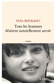
Tous les hommes désirent naturellement savoir Nina Bouraoui JC Lattès (2018年2月版)

今年的诺贝尔文学奖因为瑞典学院的性丑闻事件而被迫暂停一次,为了弥补正式奖项缺席的遗憾,今年有一个“诺贝尔替代奖”,法国作家妮娜·布拉韦伊就在候选名单上。