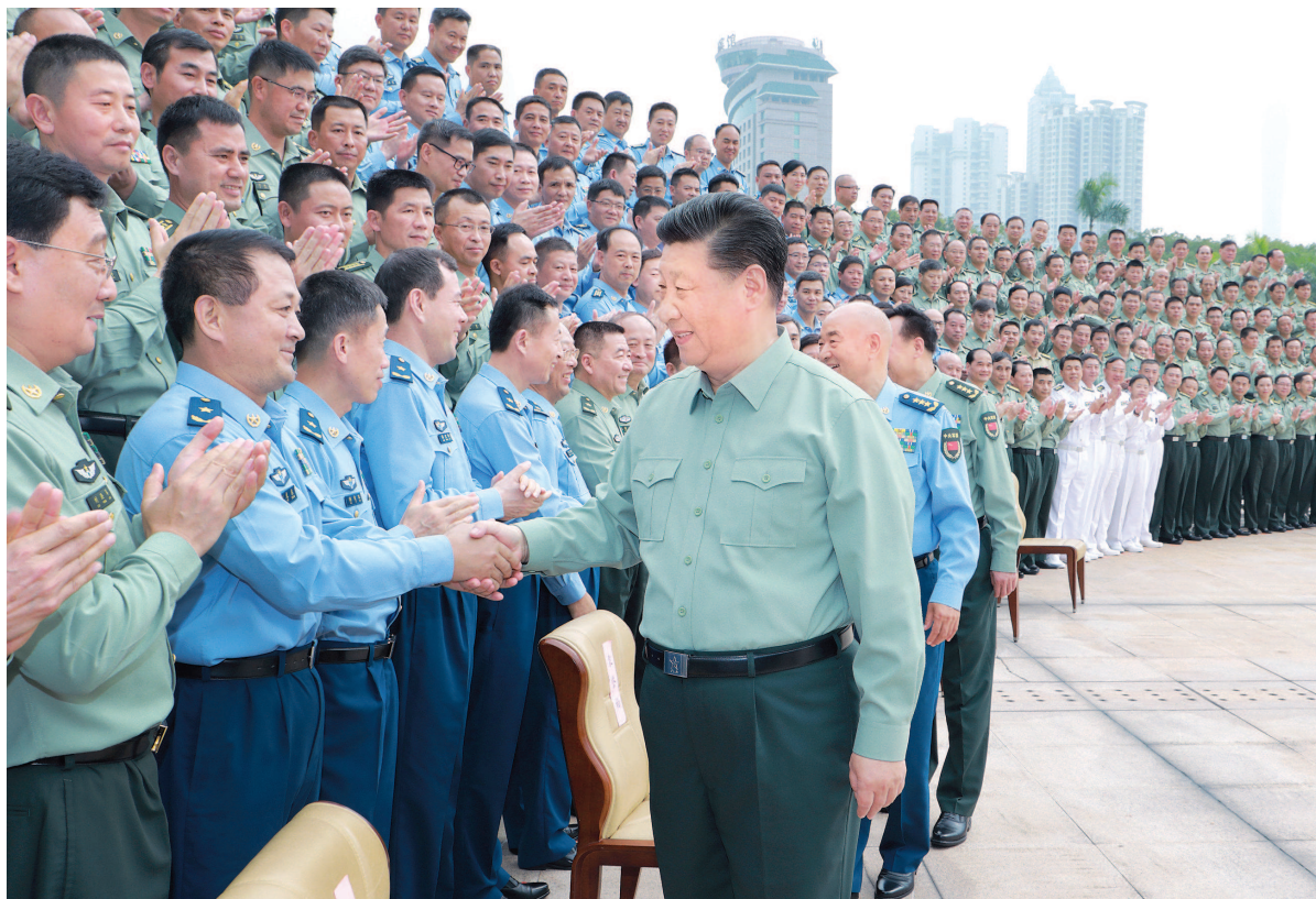
习近平亲切接见驻广东部队副师职以上领导干部。