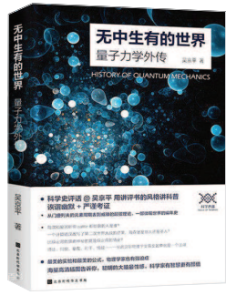
《无中生有的世界： 量子力学史话》 吴京平著 北京时代华文书局出版

当我们仰望星空时，很少有人想到，这些繁星其实都来自过去，每颗星星与地球都有着光年的距离，璀璨星空，是不同星星在不同时期的拼图，而我们却总是认为这些繁星是在同一时刻、甚至是此时此刻的景象。甚至我们白天看到的太阳，也是8分钟前的太阳；你看到的对面那个人，也是0.000000001秒前的那个人，此时此刻的人或物，你永远看不到。我们活在过去式中，除了你的思维——我思故我在，是现在进行时。