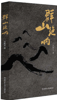
《群山绝响》 方英文著 陕西师范大学出版社 (二〇一八年六月版)

小说不仅写出了时代带给楚子川农民们的前进动力，也写了他们在时代进程中的各种难题和困境、由此产生的苦恼以及痛苦思考，所以，虽然方英文只写了看上去平常的事情，却有着强大的艺术真实。不论马会计用核桃壳盖章，还是用腊肠肉票送礼上高中，那些蜿蜒而来的历史往事，让现在的读者知晓那个年代的人民疾苦和