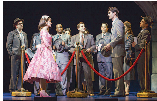
新音乐剧《罗马假日》宣传照。

据悉, 新音乐剧《罗马假日》还处于研发孵化阶段, 自2017年5月在旧金山预演起至今, 已经历过数轮修改和磨合。此次在上海举行的“剧本朗读会”将针对中国观众的反馈意见, 在该剧登上百老汇和伦敦西区的舞台前进一步打磨优化。