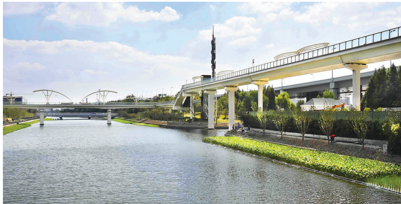
国家会展中心(上海)二层步行街延伸工程已全面完工, 从虹桥商务区核心区步行至“四叶草”仅需10多分钟。