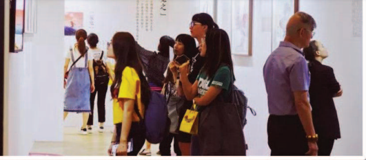
▲ 西西弗书店在上海世茂广场开设了全国首家旅行主题店,精选万余种旅行人文图书,并配合相关图书推出杉泽《山海经》手绘图鉴展。