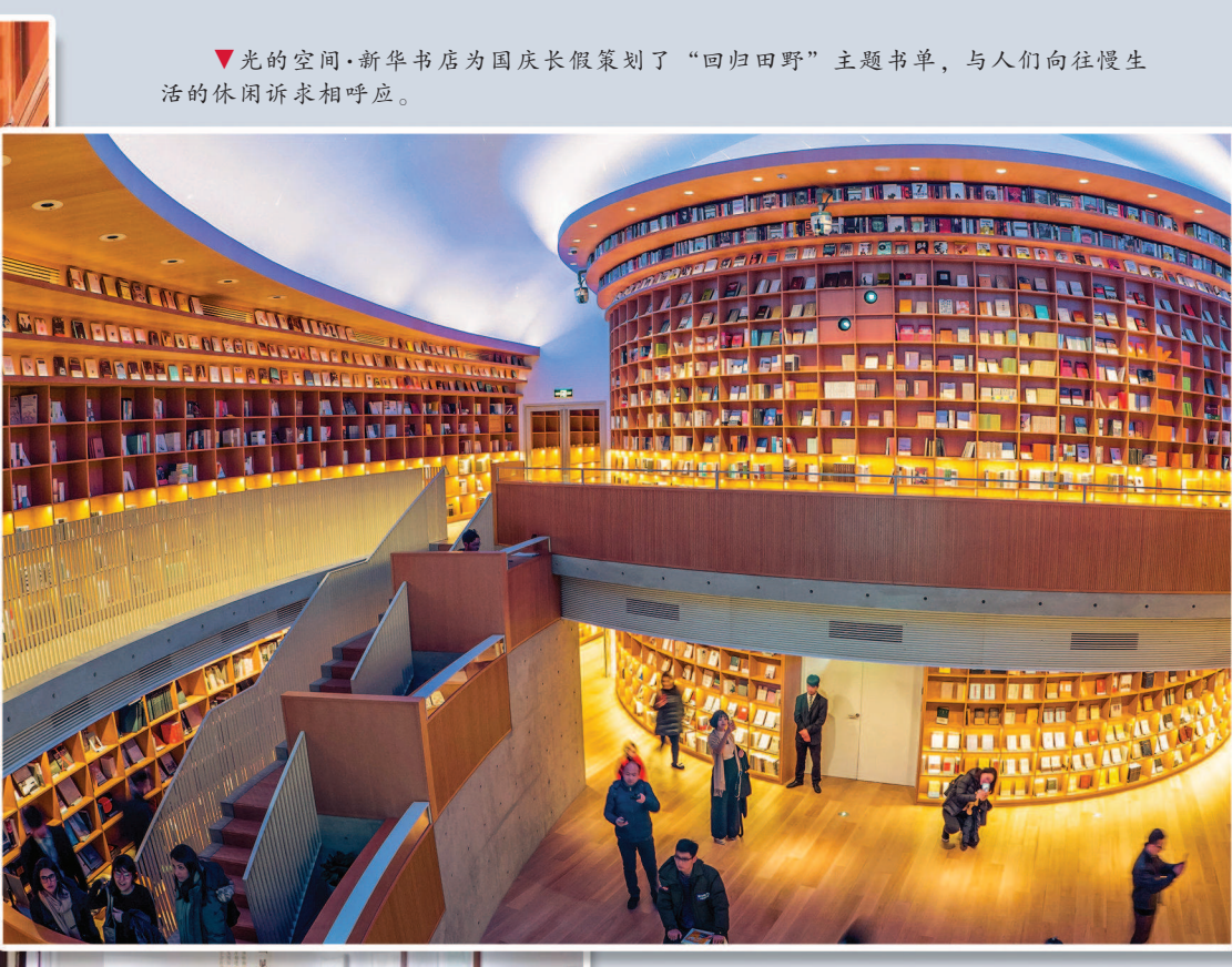
▼ 光的空间·新华书店为国庆长假策划了“回归田野”主题书单,与人们向往慢生活的休闲诉求相呼应。