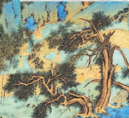
▲王时敏《秋山白云图》(局部),故宫博物院藏清初“四王”绘画特展展品