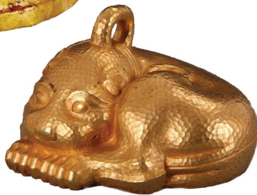
▲商周金面具,“金色记忆——中国14世纪前出土金器特展”展品 ▲宋人《冬日婴戏图》(局部),“书画菁华特展”展品 ▲西汉金兽,“金色记忆——中国14世纪前出土金器特展”展品