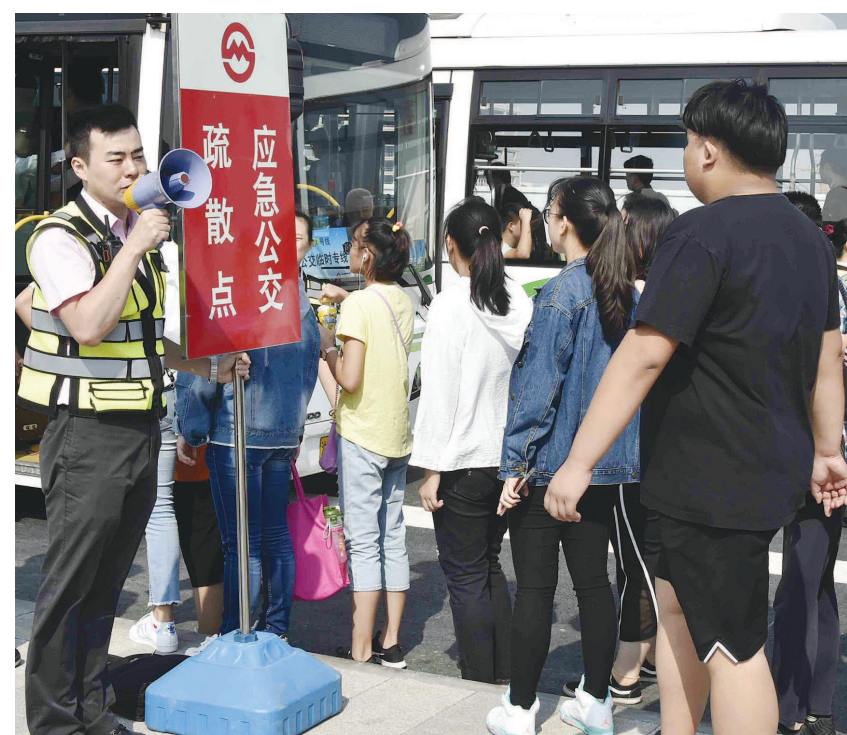
在交通安全保障应急处置千人综合演练中,地铁乘客接受引导转乘大巴。

号线,或步行至位于国家会展中心(上海)东侧的进口博览会P6停车场乘坐公交车,采用多点疏散、错峰出馆、接驳运输等多种措施疏散客流。