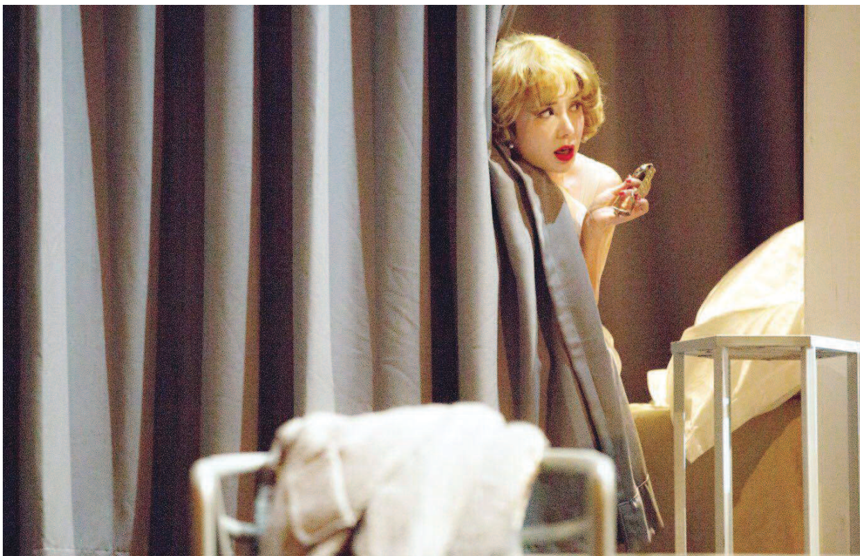
话剧《明年此时》中秋期间登台东方艺术中心。剧中的男女主角经历了25年的一期一会，每一次见面两人都在一座海滨旅馆里幽会。

和男女主角的经历同样令人感慨的，是25年时光里美国社会的风云变幻。在他们最初相遇时，美国笼罩在冷战前期的阴云下；到了1956年，猫王、电视机和娱乐产业开始流行；到了上世纪60年代，女主角穿上了嬉皮士服装，男主角则在越南战争中失去了儿子；受到美国女权运动的影响，1971年的女主角成功创业，成为独立一面的生意人……原本将海边旅馆作为尘世烦恼庇护所的二人，其实无可避免地被刻上了时代的烙印。该剧的每个时