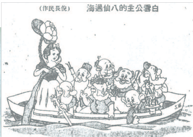
1938年圣诞节,《申报》刊载了漫画《白雪公主的八仙过海》,白雪公主变身为手捧莲花的何仙姑,与七个小矮人一起“八仙过海”。