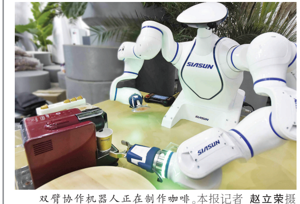
双臂协作机器人正在制作咖啡。

本报讯 在2018年全国“质量月”活动开展之际,上海市质量大会昨天召开。市委副书记、市长应勇强调,质量无处不在,质量就是生命!要深入贯彻落实以习近平同志为核心的党中央的重大战略部署,在市委领导下,紧紧抓住“创新、标准、品牌、法治”四大关键要素,深入开展质量提升行动,加快建设具有国际竞争力的质量高地,不断推动上海高质量发展迈上新台阶,进一步提升城市能级和核心竞争力,更好满足人民日益增长的美好生活需要。 会上,应勇颁发2017年度上海市市长质量奖,并与副市长许昆林等共同颁发上海市质量金奖。上海电力设计院有限公司、上海振华重工(集团)股份有限公司总裁黄庆丰获市长质量奖。▼ 下转第三版