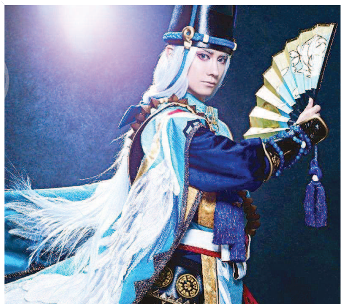
由中日联合出品的音乐剧《阴阳师》今年上半年亮相上海,八场演出一票难求。图为音乐剧《阴阳师》海报。

二次元舞台剧的另一个基本特质,是拥有数量庞大的粉丝群体,直接带来强劲的票房号召力。这推动了国内各类