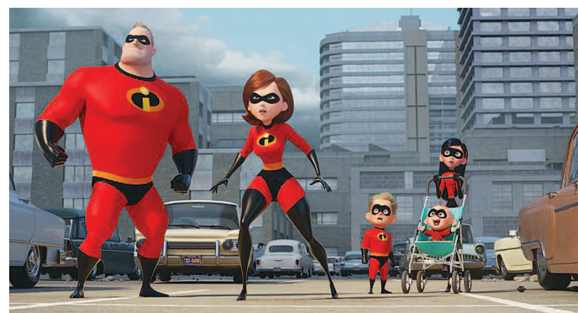
《超人总动员2》摘得今年北美暑期档榜首的同时,也成为北美影史首部票房收入过6亿美元的动画片。图为影片剧照。