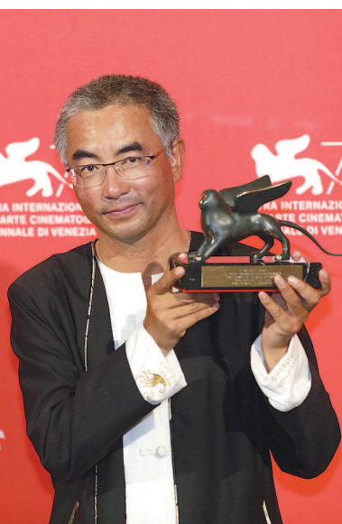
万玛才旦手捧奖杯。

本报讯（首席记者王彦）第75届威尼斯电影节颁奖典礼于当地时间9月8日晚举行。由王家卫监制、上海泽东电影出品制作、万玛才旦执导的电影《撞死了一只羊》获得“地平线单元”最佳剧本奖。这是本次电影节唯一一部在竞赛单元获奖的中国电影，也是万玛才旦个人导演生涯在欧洲三大电影节的重要奖项。