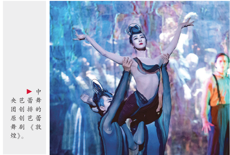
▲中央芭蕾舞团创排的原创芭蕾舞剧《敦煌》。