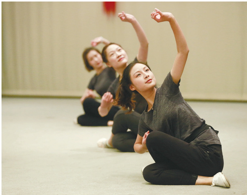
上海越剧院夏季集训为青年演员设置了艺术体操课程。

上海越剧院的青年演员已经在高温下奋战了近三周。“这可能是戏曲院团周期最长的夏季集训。”上海越剧院院长梁弘钧说这话并非因为自豪。针对青年演员系统化有规模的夏季集训，越剧院今年刚做到第三期。一个半月的集训也可以说是“补课”——用在台上“诗情画意”的越剧演员自己的话说，是该从基础着手下点苦功了。