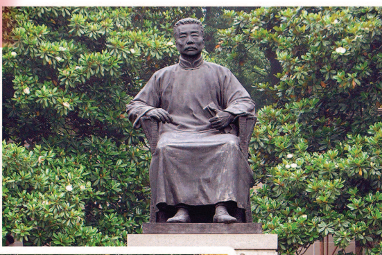
▼上海鲁迅公园内的鲁迅坐像。