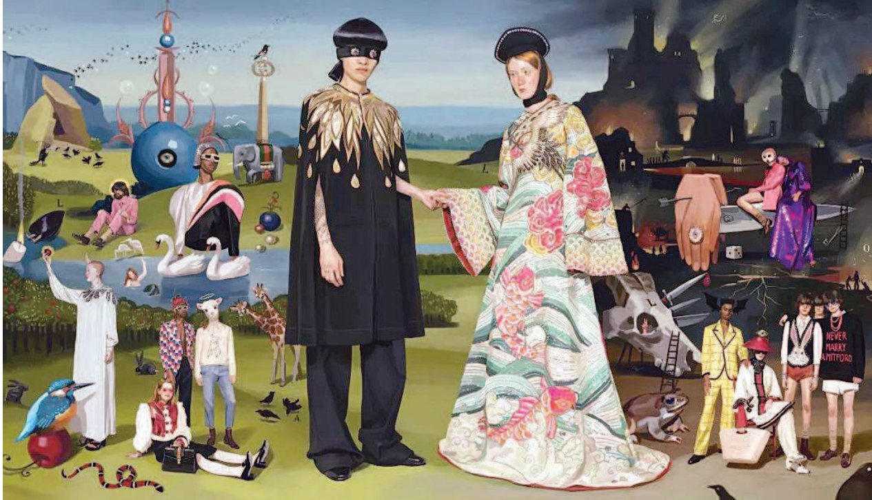
近年来,不少大品牌开始采用卡通图案,掀起了一股“成人服饰低龄化”的潮流。