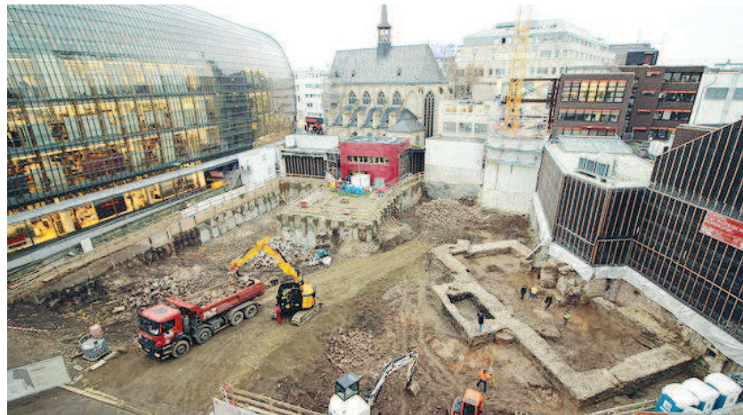
近日,德国境内第一座古罗马时期图书馆在科隆市中心出土。(资料照片)

与此同时,遗址所在的市中心位置以及建筑所用的材料都与同时期的图书馆相匹配。虽然目前遗址只剩下房屋的一小部分,但研究人员将尝试通过分析来说明面积过小,但对于盛放书籍和卷轴