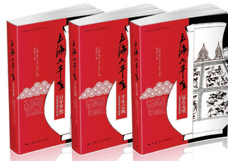
上海发展史普及读本《上海六千年》即将由上海人民出版社出版。

据悉,上海市地方志办公室、上海市教育发展基金会将陆续推出《上海六千年》的小学生版、大学生版以及普及版等,计划在五年内出版完成。