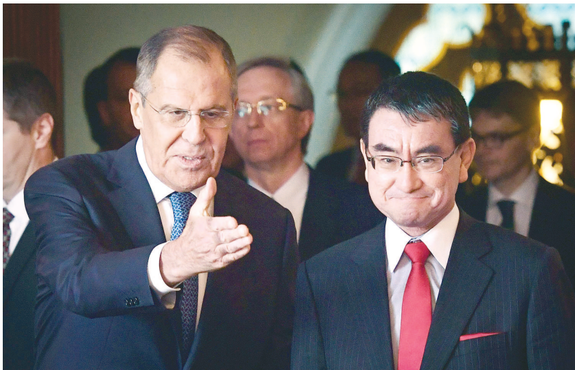
7月31日,莫斯科,俄罗斯外长拉夫罗夫与日本外相河野太郎举行会晤。

有分析认为,在刚刚结束的赫尔辛基峰会上,美俄领导人会晤的唯一成果即在国际安全领域达成了一些共识。路透社消息称,为落实这些共识,美俄防长或将三年来首次会晤。在此背景下,俄方对日本此举表示关切显得恰逢其时。在此次“2+2”会谈上,日本则更多