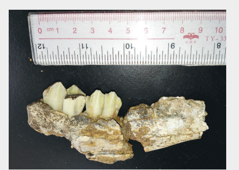
▲在上陈遗址发现的牛科化石下颌骨残骸侧面(埋藏于S27中,年代约210万年)。