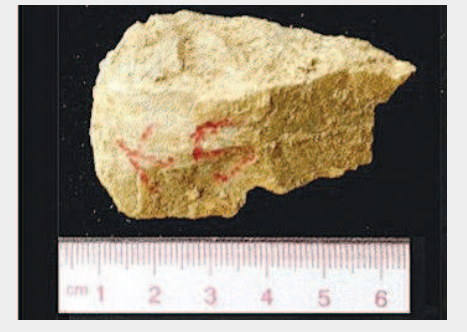
▲上陈遗址—第28层黄土中出土的石片工具。