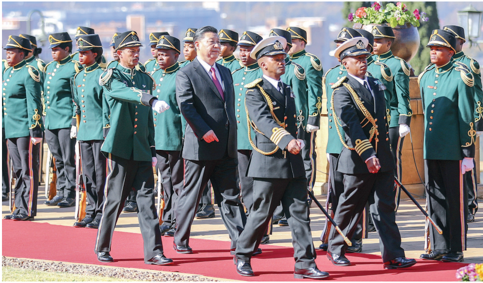
7月24日，国家主席习近平在比勒陀利亚同南非总统拉马福萨举行会谈。会谈前，拉马福萨为习近平举行隆重欢迎仪式。