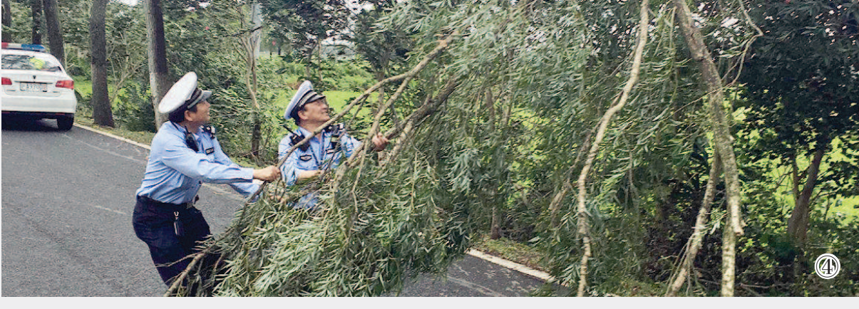
图①：昨天凌晨，闵行民警赶赴华宁路元电路，联合各部门抢修因风雨坠地的高压线。 图②：昨天上午，奉贤民警劝离仍滞留在靠港避风渔船上的渔民。 图③：昨天上午，青浦区1000千伏特高压练塘站电力工人冒着风雨对输电线路开展特巡。 图④：昨天，崇明区公安交警在巡查中清理被台风刮断的树枝。

特巡。除了日常频次巡检，他们每隔四个小时就要穿上厚重雨衣，到户外场地对主变压器、GIS、高抗等重要设备进行特巡，及时清理各种易飘物。