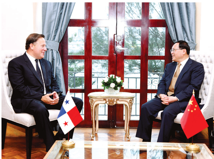
巴拿马总统巴雷拉会见中共中央政治局委员、上海市委书记李强。

应巴拿马主义党邀请，李强率中共代表团于7月17日至19日访问巴拿马。其间，李强还分别会见巴拿马主义党主席何塞·巴雷拉和巴拿马城市长布兰顿，见证上海市同巴拿马城签署两市合作交流意向书，考察科隆自贸区，出席上海改革开放40年成就图片展。