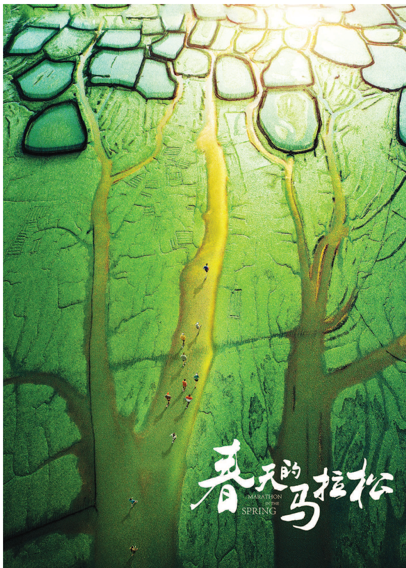
《春天的马拉松》“启程版”海报。

发布会现场的一条短片生动介绍了影片的创作背景,而一本掌心小册子(即《36条》),则让人更直观地了解到影片的创作基础——浙江宁海从2014年开始推行小微权力清单制度,梳理颁布了《36条》,其中分类涉及村级集体管理事项、便民服务事