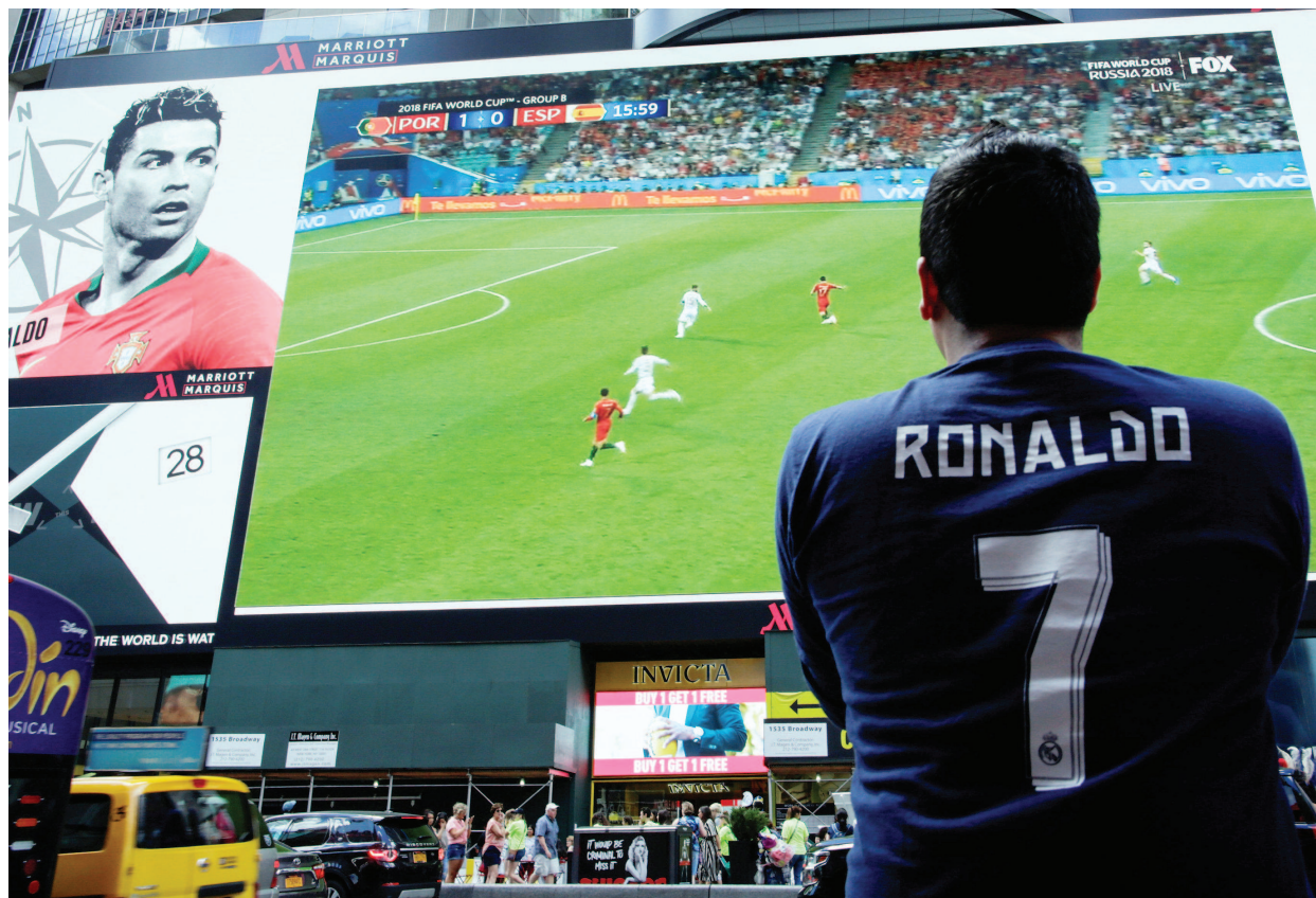
在纽约时代广场，一位C罗的球迷观看葡萄牙的比赛。由于美国队未进入决赛圈，许多球迷会支持母国。

美国人看足球主要图的是热闹：气氛第一，友谊第二，比赛第三。所以多数人看球不是去现场，就是去酒吧。就算是在家看，也要邀请几位朋友喝着啤酒一起看。据国际足联日前发布的消息，在2018年世界杯门票购买者中，除了东道主俄罗斯人以外，最多的